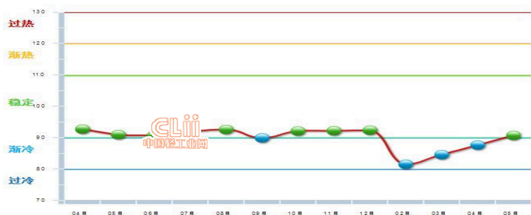
图 1.1 2016.4~2017.5 电池行业景气指数变化态势

2017年受电池行业利润下滑的影响，2月起中轻电池景气指数跌入“渐冷”区，3月后中轻电池景气指数开始逐步回升，5月指数重回“稳定”提示区。2017年5月中轻电池景气指数为90.7，与4月87.62比上升了3.08的百分点，进入“稳定”提示区。（参见图1.1）