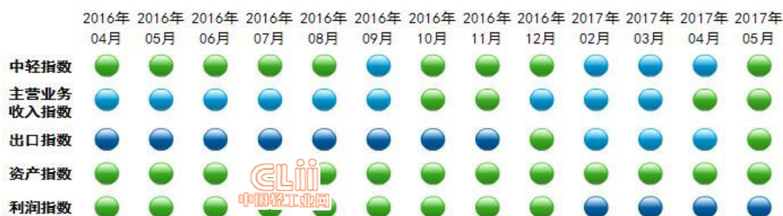
图 1.2 2016.4~2017.5 电池行业景气指数预警信号灯变化态势

从各指数预警信号灯看（参见图1.2），5月中轻电池景气指数与出口指数信号灯开始转绿。