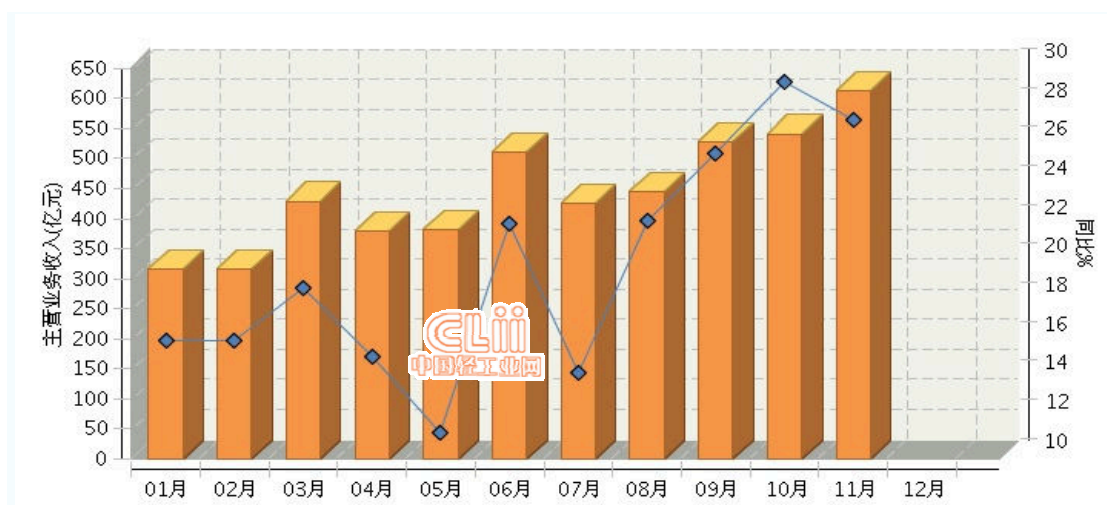
图 2.2 2016年全国电池行业月度主营业务收入及同比

2016年1~11月,全国电池行业累计完成主营业务收入同比增长 20.55%。其中:10月份完成主营业务收入同比增长 27.36%。(参见图2.2)