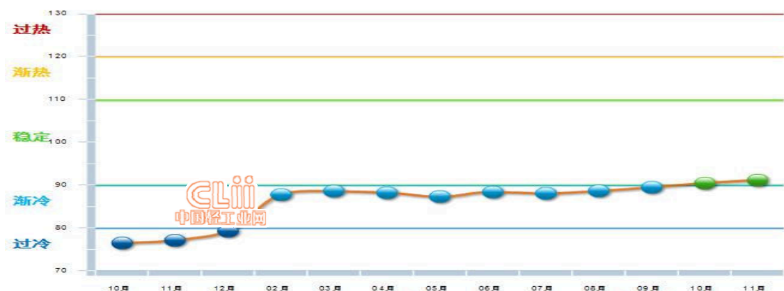
图 2.1 2015.10~2016.11 电池行业主营业务收入景气指数变化态势

2016年1至9月电池主营业务收入景气指数一直在“渐冷”提示区运行,10至11月进入“稳定”提示区,11月主营业务收入景气指数比10月上升了0.69个百分点。(参见图2.1)