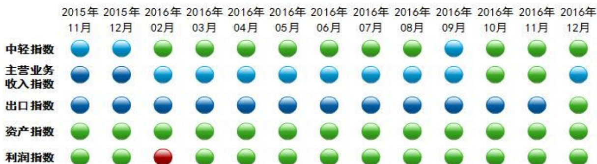
图 1.2 2015.11~2016.12 电池行业景气指数预警信号灯变化态势

从各指数预警信号灯看（参见图 1.2），12 月出口指数结束长期的“过冷”，快速进入“稳定”期间、主营业务收入指数由“稳定”区滑入“渐冷”区。