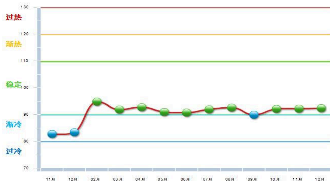
图 1.1 2015.11~2016.12 电池行业景气指数变化态势

2016 年除 9 月受电池行业出口下滑的影响，中轻电池景气指数“渐冷”外，中轻电池景气在“稳定”区运行。12 月中轻电池景气指数为 92.35，与 10 月 92.19 基本持平。（参见图 1.1）