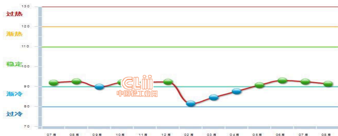
图 1.1 2016.7~2017.8 电池行业景气指数变化态势

2017年3月起中轻电池景气指数开始逐月回升,5月指数重回“稳定”提示区。2017年8月中轻电池景气指数为91.36,与7月92.45相比下降了1.09个百分点,继续停留在“稳定”提示区。(参见图1.1)