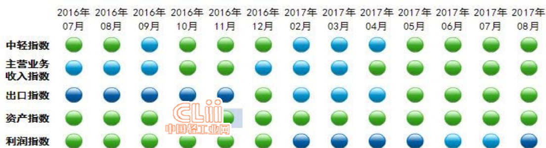
图 1.2 2016.7~2017.8 电池行业景气指数预警信号灯变化态势

从各指数预警信号灯看(参见图1.2),8月中轻电池景气指数基本稳定,利润指数信号灯由“渐冷”转向“过冷”。