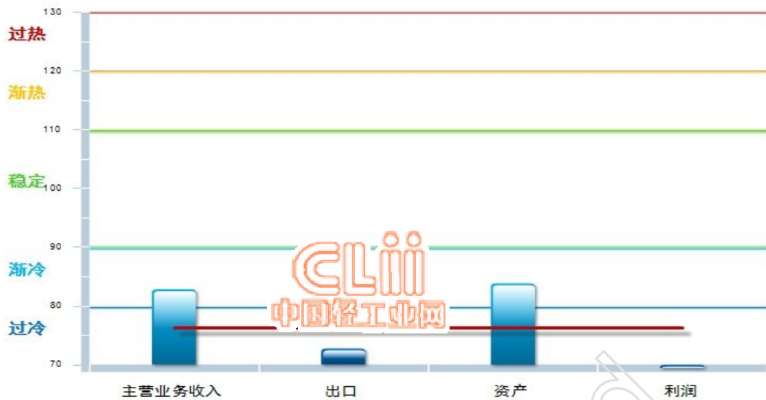
图 1.4 2013 年 6 月 电池行业景气指数分指标显示状况