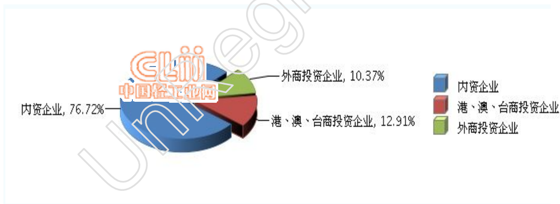
图 1-1 2013 年全国电池行业企业数企业注册类型占比情况

2013 年全国规模以上电池企业中，内资企业 903 家，占比 76.72%，与 2012 年相比占比上涨 0.42 个百分点，继续占主导地位；港、澳、台商投资企业 152 家，占比 12.91%；外商投资企业 122 家，占比 10.37%。（参见图 1-1）