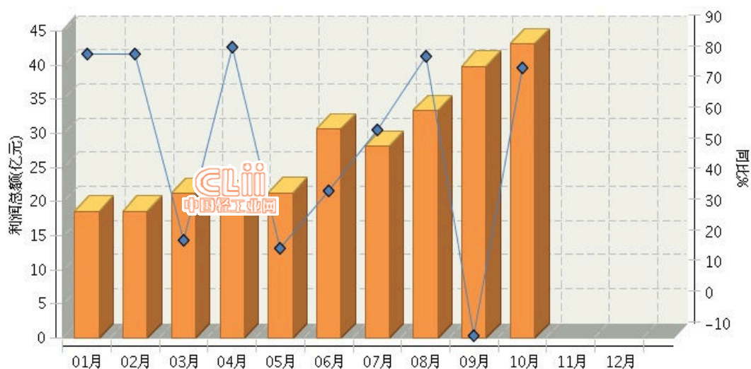
图 3.2 2016年全国电池行业月度利润总额及同比

2016年1~10月，全国电池行业累计完成利润总额同比增长42.35%。其中：10月份完成利润总额同比增长77.83%。