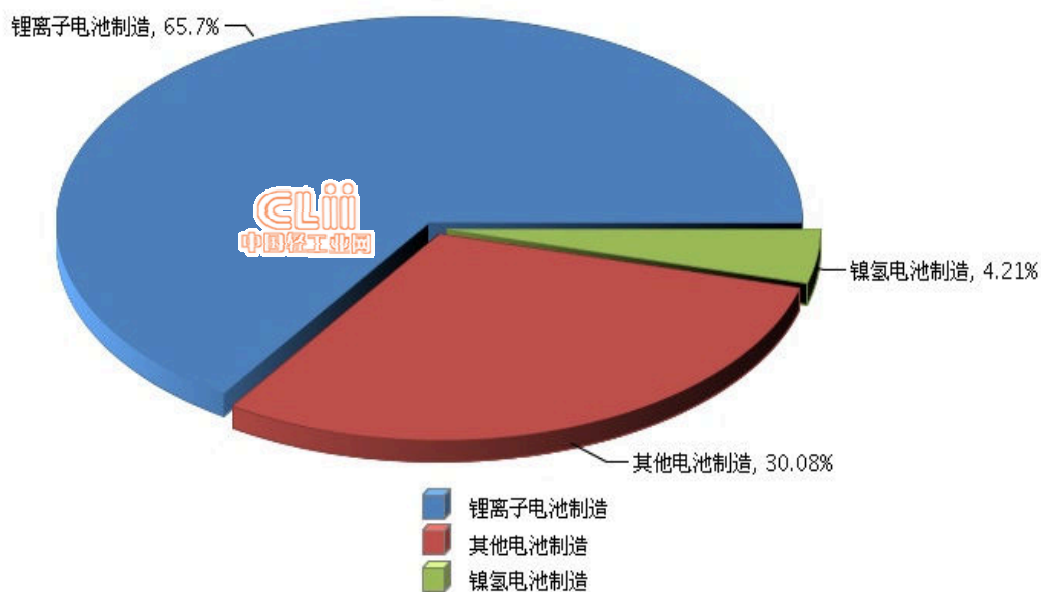
图 3.3 2016 年 1~10 月全国电池行业累计利润总额行业小类占比情况

从子行业看，锂离子电池制造完成累计利润总额占 65.7%，同比增长 85.12%；其他电池制造完成累计利润总额占 30.08%，同比增长 -1.64%；镍氢电池制造完成累计利润总额占 4.21%，同比增长 1.05%。（参见图 3.3、图 3.4）